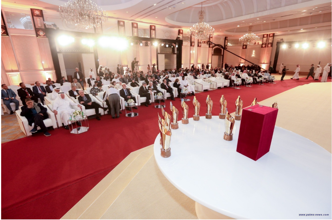
نخيل نيوز/ متابعة

عقدت "جائزة الدوحة للكتاب العربي" مساء أمس الأحد دورتها التأسيسية بوصفها جائزة سنوية مقرها العاصمة القطرية، ومدارها الكتاب المؤلف بالعربية، لتكريم الباحثين ودور النشر والمؤسسات المسهمة في صناعة الكتاب العربي، وفتحت باب الترشح عبر الموقع الرسمي لها، بدءاً من الخامس من الشهر الجاري، حتى الخامس من حزيران/ يونيو 2024.