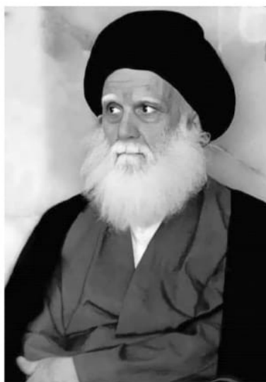
Pic. 1. Charismatic leadership Al-Sayyid Mohammad Mohammad Sadeq Al-Sadr