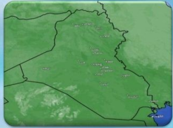
صورة الأقمار الصناعية صباح هذا اليوم